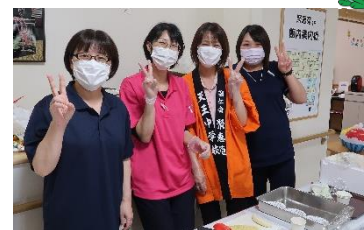
スタッフ総出で頑張りました！

ゲームを全部クリアしてシールを集めると、お菓子やスイーツ・アイスがGETできるシステム！ 皆さん頑張って参加していました。