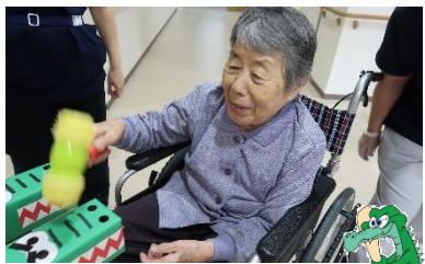
ワニワニパニック

新型コロナの影響で夏祭りを見送っていましたが、感染対策を十分に行ったうえで、外部からの参加はない形で行いました。