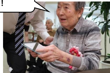
記念品プレゼント